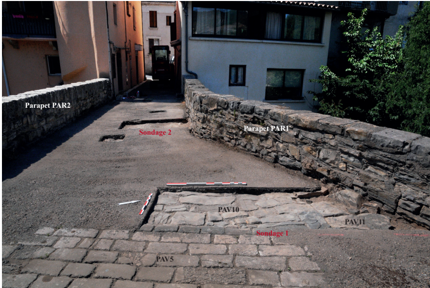
Fig. 2 : Les sondages 1 et 2 après enlèvement de l'enrobé.