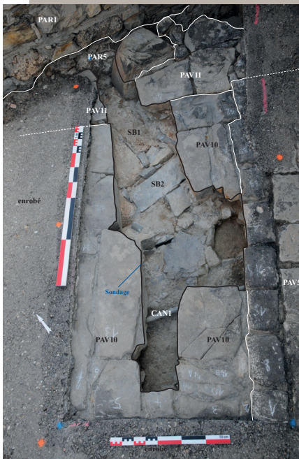
Fig. 3 : Le sondage 1 en fin d'intervention.