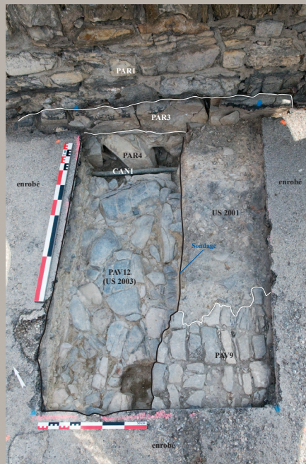
Fig. 4 : Le sondage 2 en fin d'intervention.

Plusieurs phases de construction ou de reconstruction du parapet ont également été observées. La construction PAR3 est une assise d'un ancien parapet sur laquelle s'est implanté le parapet actuel PAR1. Sous PAR3, la maçonnerie PAR4 pourrait être une assise d'un parapet plus ancien, ou plutôt appartenir à la structure interne du tablier du pont.