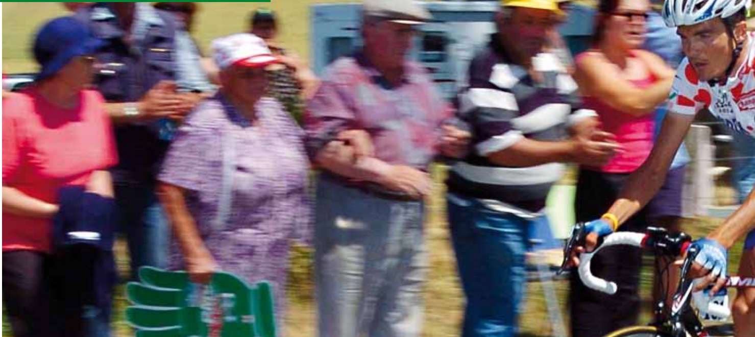
Richard Virenque entre Entraygues et Montsalvy en 2004