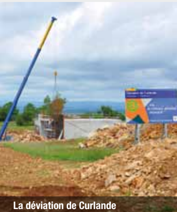
La déviation de Curlande

et proposer des activités. Le développement économique constitue le second axe de ce développement. Deux projets ont été plus spécialement retenus. Il s'agit d'abord de l'accueil de la petite enfance avec la création de micro-crèches à Gages (dans un premier temps) et à Lioujas. La construction, avec l'aide du Conseil général, d'une salle multisports d'envergure régionale à Bozouls (un investissement de 2,5 M€) constitue la seconde priorité. La vétusté des équipements actuels et leur inadaptation aux besoins le rendent nécessaire. Ce nouvel ensemble s'intégrera dans un complexe plus vaste de sports et de loisirs. L'objectif est de parvenir à une offre aussi diversifiée que possible de disciplines. Il s'agit d'apporter une réponse à une demande locale pressante qui s'explique notamment par le dynamisme démographique de l'ensemble du canton. Cette opération s'inscrit également parfaitement dans la politique en direction des adolescents mise en place par la communauté de communes de Bozouls-Comtal.