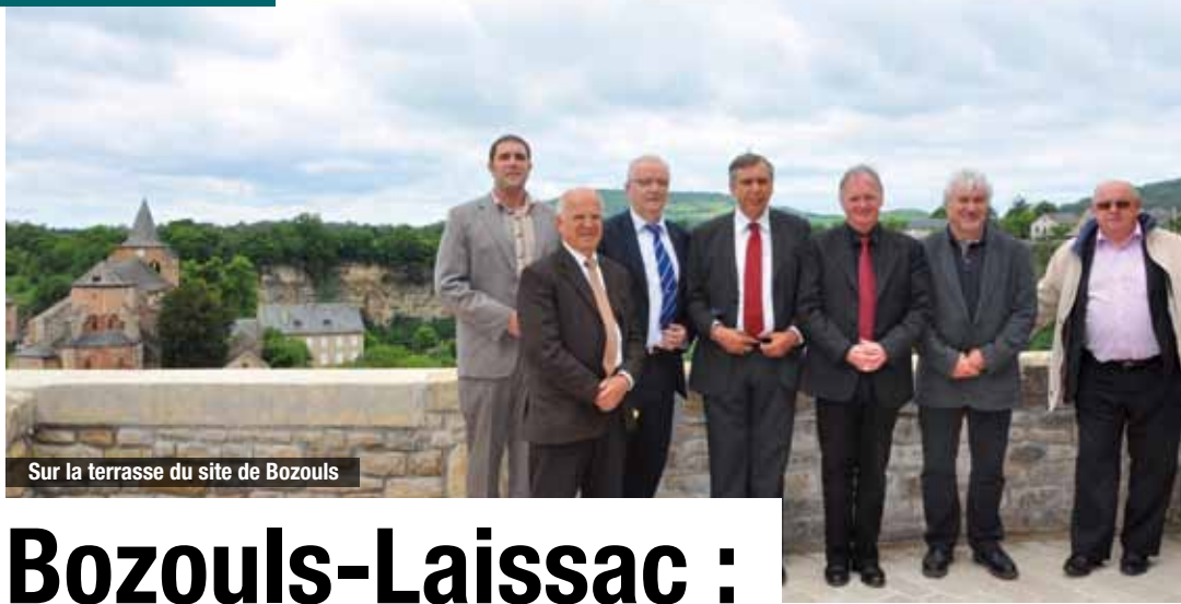
Sur la terrasse du site de Bozouls