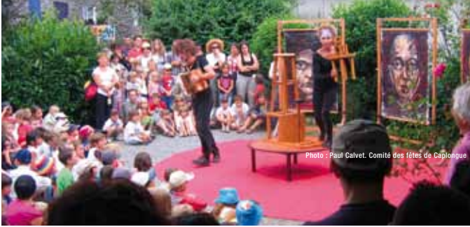
Comité des fêtes de Caplongue