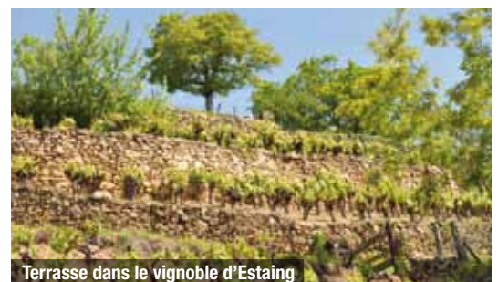
Terrasse dans le vignoble d'Estaing

développement touristique de la vallée du Lot.