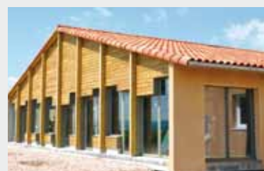
Le chantier de Belmont-sur-Rance

La zone artisanale de Saint-Pierre-de-Rebourguil s'étend sur 4 hectares du Rougier, bien située au carrefour de la route départementale réaménagée pour faciliter cette réalisation.