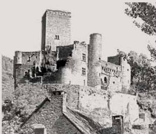
Le site de Belcastel