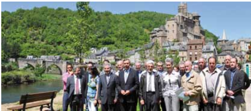
Sur les quais du Lot réaménagés à Estaing

Les cantons d'Espalion, Estaing et Entraygues sont naturellement engagés dans des démarches de développement durable. Deux exemples : le lancement du chantier de la station d'épuration et les vignobles.