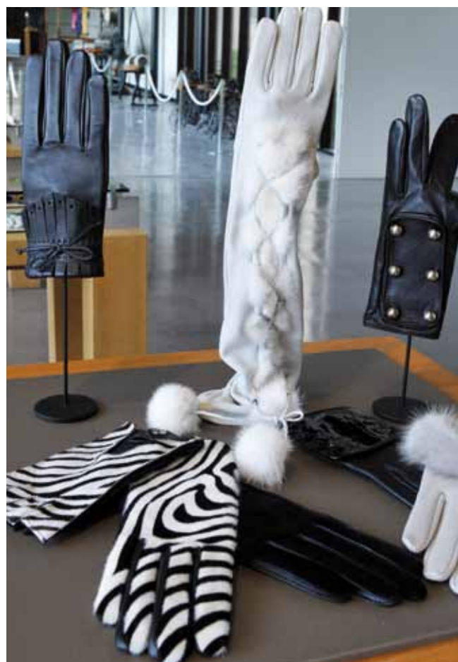
Pour la haute couture

Aujourd'hui, le chiffre d'affaires de la manufacture Causse est assuré à 80% par le travail avec les marques de luxe, le reste l'étant par la marque Causse elle-même dont on trouve tous les modèles dans une superbe boutique ouverte à Paris, à deux pas de la place Vendôme. Elle a été génialement conçue par l'architecte de la manufacture, Jean-Michel Wilmotte.