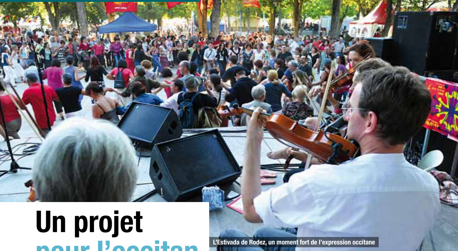
L'Estivada de Rodez, un moment fort de l'expression occitane