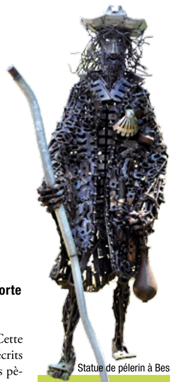
Statue de pèlerin à Bessuéjols