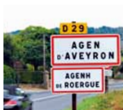
La signalisation bilingue se met en place

30 % des enfants devraient être sensibilisés à la langue