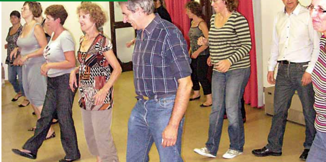
La danse à proximité