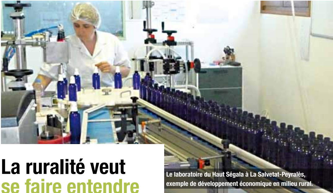
Le laboratoire du Haut Ségala à La Salvetat-Peyralès, exemple de développement économique en milieu rural.