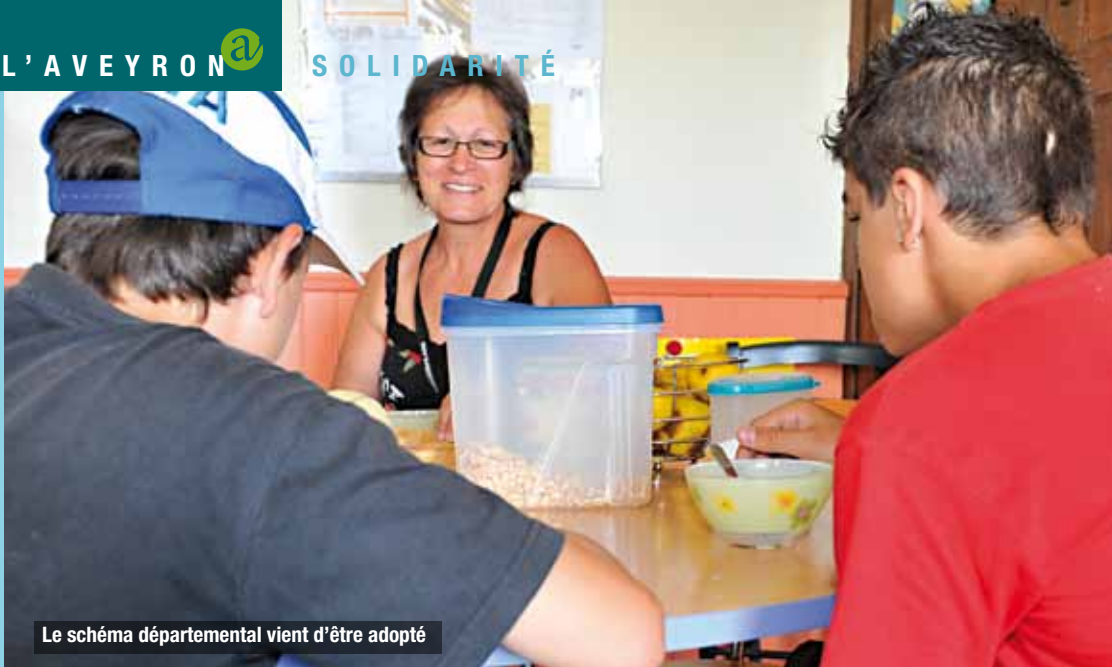
Le schéma départemental vient d'être adopté