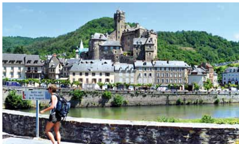
Passage sur fond de château d'Estaing

gogiques sont apposées, pour informer et sensibiliser le public de la valeur exceptionnelle du tronçon ou du monument, de sa signification universelle et de l'univers culturel qu'il représente.