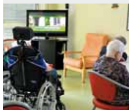
D'importants moyens du Conseil général pour les établissements

Les crédits affectés pour des suites d'opérations concernent les établissements suivants : Saint-Cyric Rodez, Denys-Affre à Saint-Rome-de-Tarn, Lugan, Belmont-Camarès, résidence André Calvignac à La Salvétat-Peyralès, Les cheveux d'ange à Millau, Sainte-Marie à Nant, Saint-Jean à Saint-Amans-des-Côtes, La Roussilhe à Entraygues. Les crédits pour des opérations nouvelles concernent : La Rossignole à Onet-le-Château, Jean-Baptiste Delfau à Réquista, Les Deux Vallées à Nant, Les Galets d'or à Saint-Côme-d'Olt, l'EHPAD de Firmi, Saint-Dominique à Gramond, L'Oasis à Livinhac-le-Haut, Le Gondolou au Nayrac, l'EHPAD rattaché à l'hôpital local de Saint-Geniez-d'Olt et la Maison d'accueil de l'Argence à Sainte-Geneviève. Il s'agit de dix chantiers déjà ouverts. Une nouvelle répartition se fera en fin d'année en fonction de l'avancée d'autres projets.