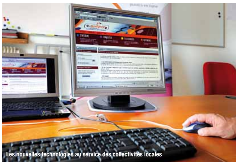
Les nouvelles technologies au service des collectivités locales