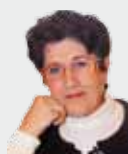
Présidente de la commission Enfance, famille et prévention des risques

Aussi s'agit-il de définir l'urgence pour pouvoir la distinguer et orienter ceux qui n'en relèvent pas vers les autres lieux de vie.