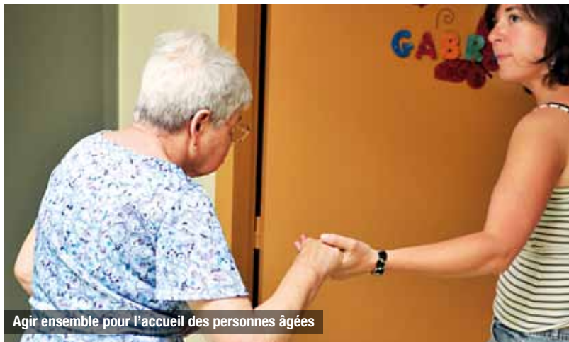
Agir ensemble pour l'accueil des personnes âgées

5,28 M€ pour les établissements d'accueil