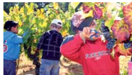
Dans les vignes du Vallon

Autre monde : celui du blé et du pain dont tous les métiers sont expliqués et ... testés. Avec un meunier, les enfants transforment le grain en farine à l'aide de moulins miniatures à manivelle puis pétrissent la pâte avec le boulanger avant de rencontrer le four traditionnel d'Onet-le-Château village.