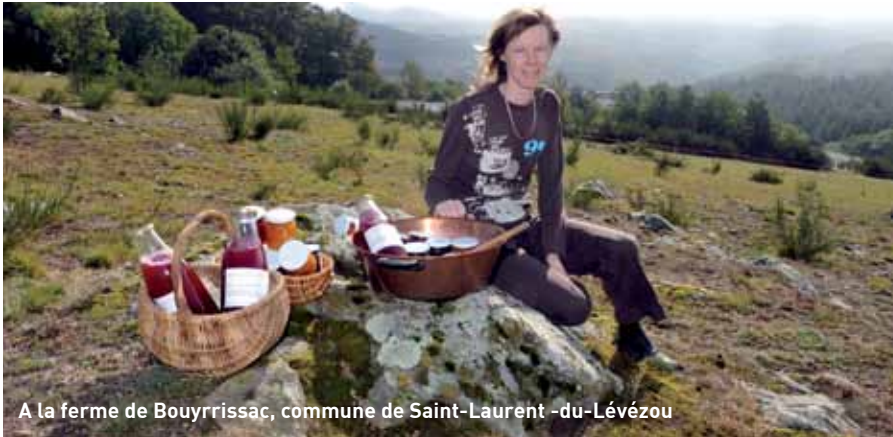
A la ferme de Bouyrrissac, commune de Saint-Laurent-du-Lévézou