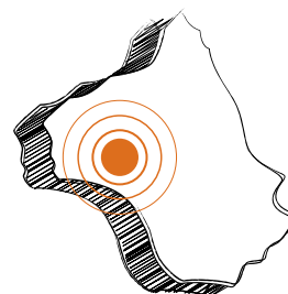
Vue sur le Ségala depuis le Puech de Flauzins