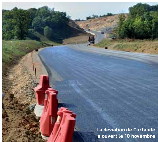
La déviation de Curlande a ouvert le 10 novembre