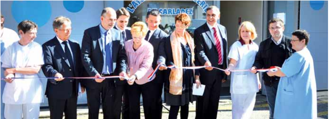
Préfète, député, président du Conseil général et élus lors de l'inauguration