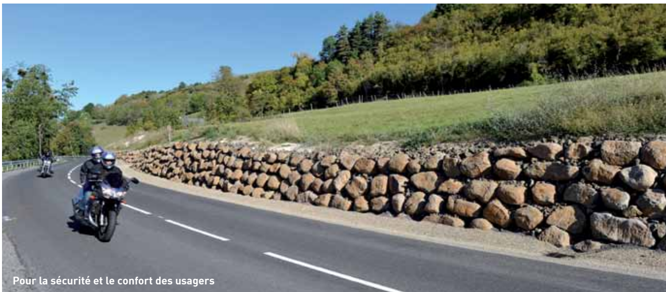
Pour la sécurité et le confort des usagers