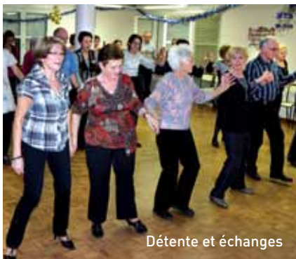
Détente et échanges

Spécificité aveyronnaise parmi les activités proposées : une animation mémoire et équilibre. Elle s'adresse à des personnes de tous les âges, vise à prévenir les chutes et garder la confiance en soi à travers des exercices ludiques. Ils apprennent mine de rien à être présent à ce que l'on fait et permettent à bon nombre de pratiquants de se rendre compte que ce n'est pas leur mémoire qui leur fait défaut mais plutôt l'habitude de la solliciter.