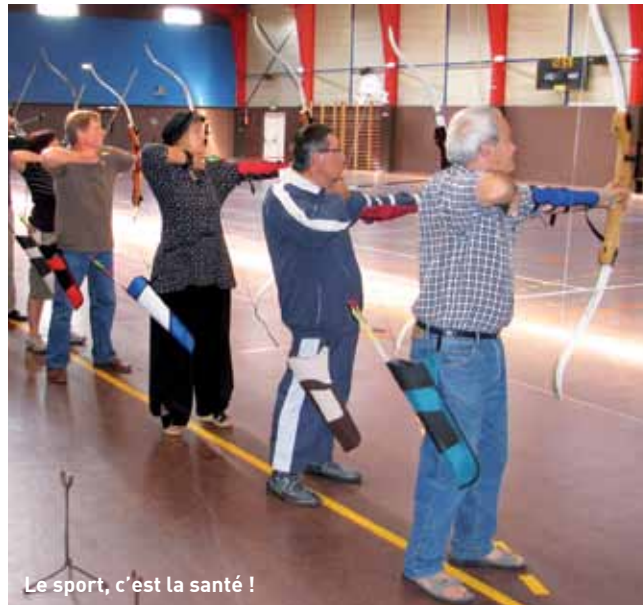
Le sport, c'est la santé !

Les activités dansées regroupent les danses collectives et les danses en ligne. Détente, échanges et relations avec les autres membres du groupe sont quelques-uns des bénéfices soulignés par la fédération nationale qui insiste également sur l'amélioration de la silhouette, l'augmentation de la résistance physique, le sommeil favorisé mais aussi l'évacuation des soucis et du stress, la timidité