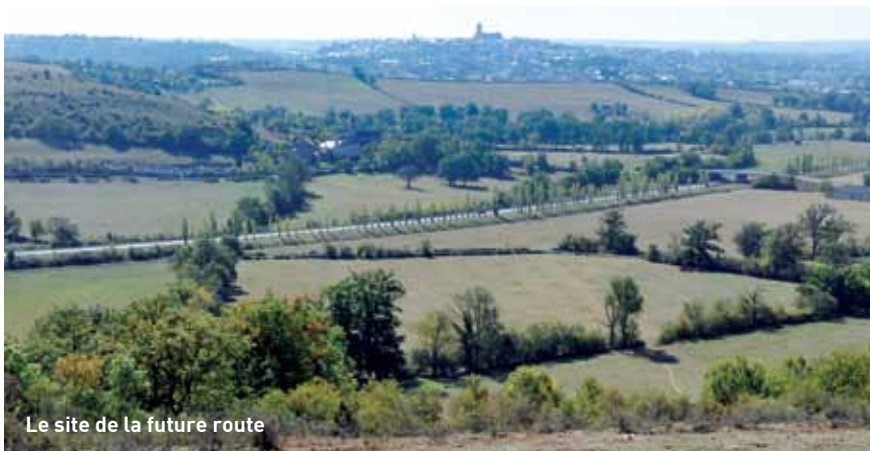
Le site de la future route

Sévérac-le-Château, traversée de l'agglomération ruthénoise comprise. Sur ce dernier point, le préfet de Région s'est voulu clair : le grand contournement de Rodez ne figure pas au Schéma national des infrastructures terrestres, valable pour les trente ans à venir. Il faut donc imaginer, a-t-il ajouté, une solution alternative – l'aménagement de la rocade existante par exemple – à discuter entre partenaires.