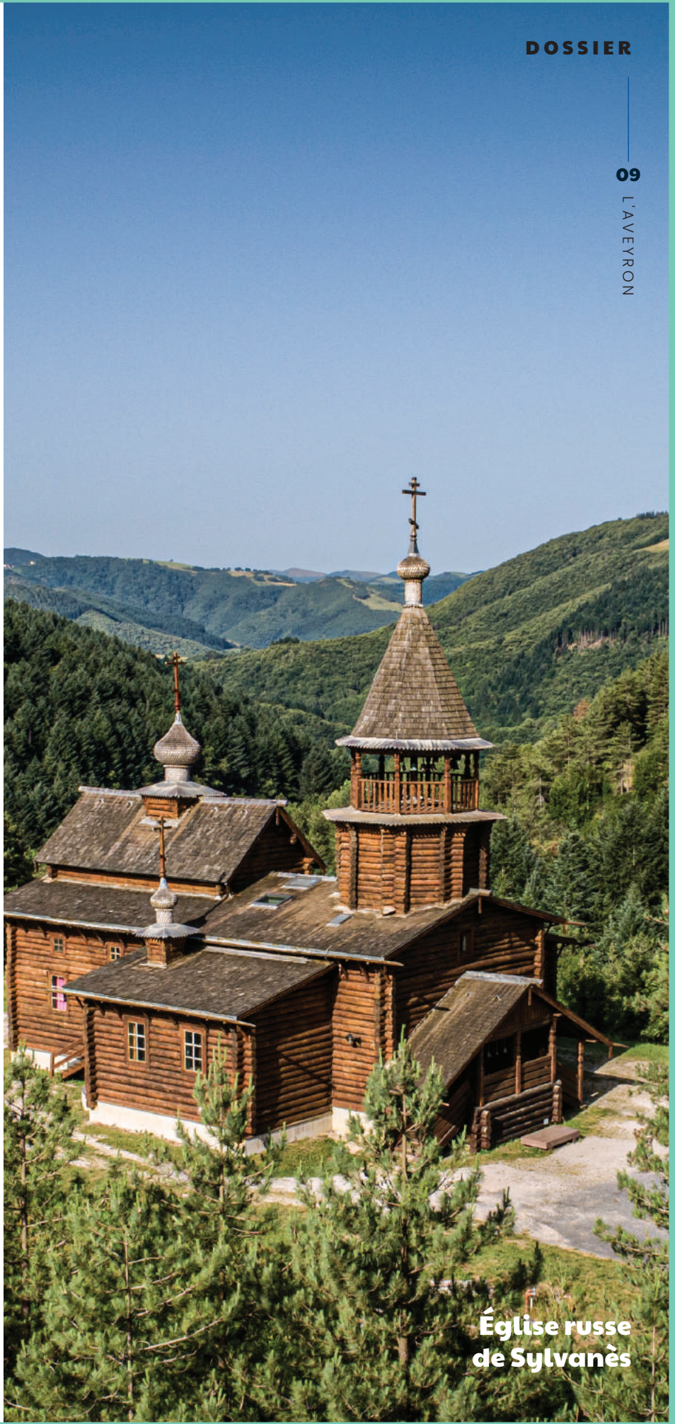
Église russe de Sylvanès

Conques, Sylvanès, Roquefort, Estaing.... Des noms qui nous parlent et qui évoquent notre histoire, nos fiertés et tant de beauté. Regroupées sous l'appellation les « Essentiels d'Aveyron », ces perles à forte valeur patrimoniale, culturelle, touristique et économique sont un des fers de lance du défi numéro 1 du programme de mandature « L'AveyrOn Se Bouge ». La communication du Département leur donnera toute la place qu'elles méritent en mettant leurs charmes sous les feux de la rampe. Au-delà de la valorisation de leur image, c'est un travail en profondeur qui sera mené par les équipes du Département et les communes concernées pour faire briller loin nos essentiels d'Aveyron.