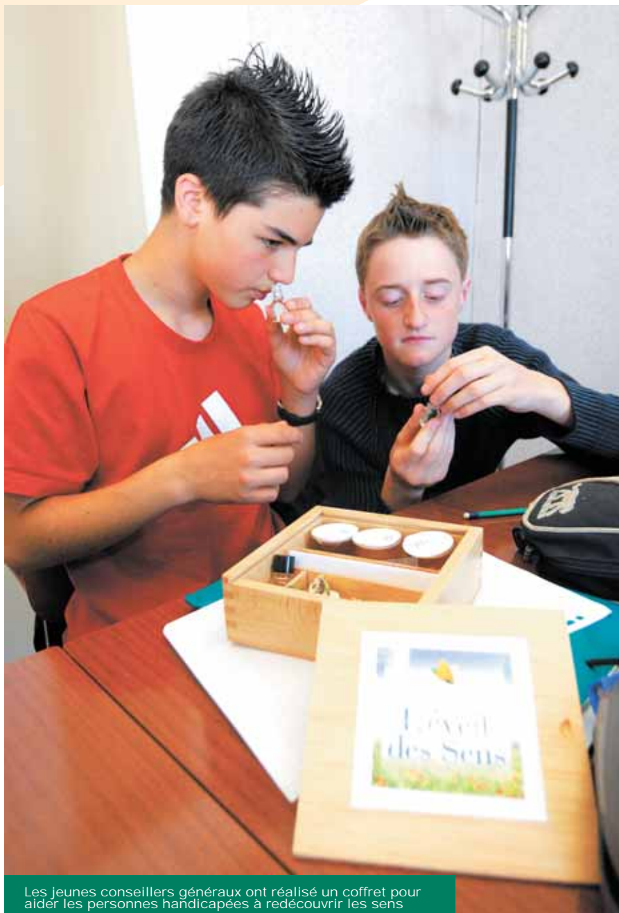
Les jeunes conseillers généraux ont réalisé un coffret pour aider les personnes handicapées à redécouvrir les sens

À noter qu'un groupe était également chargé de la communication. Ainsi, le "A" junior, le journal des jeunes Zélus, pourrait être édité en braille.