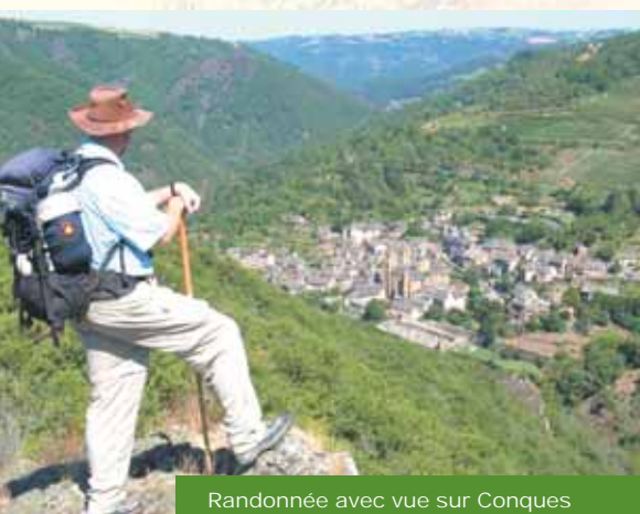
Randonnée avec vue sur Conques

> Rando occitane : les huit départements de Midi-Pyrénées invités à Rivière-sur-Tarn le 23 septembre : deux boucles afin que chacun soit libre de participer tout au long de la journée ou bien seulement à la demi-journée.