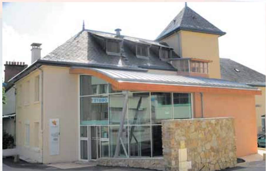
La Maison départementale des personnes handicapées dans ses murs