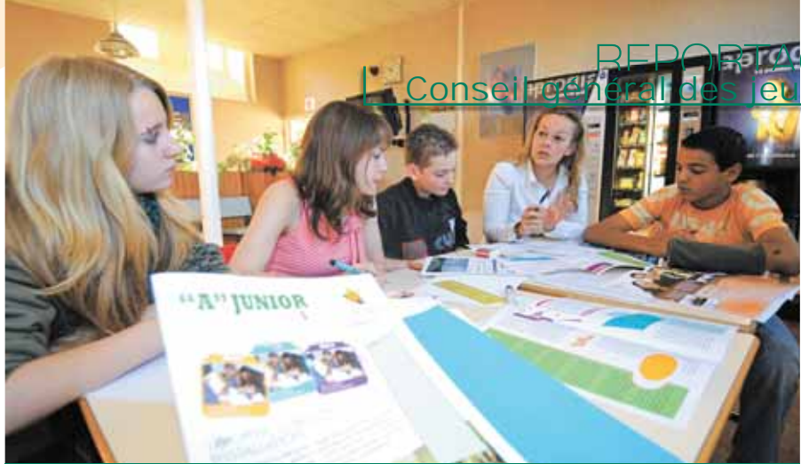
La réalisation du "Grand A" du Conseil général des jeunes

Finalement, la commission a décidé d'élaborer un guide des lieux d'hébergement, des sites culturels et de loisirs adaptés aux personnes handicapées, des associations pouvant les accueillir, seules ou accompagnées. Ce document de huit pages, imprimé à 3000 exemplaires, réalisé avec la société Bic Graphic, sera disponible gratuitement dans les établissements scolaires, les syndicats d'initiative et les offices de tourisme.